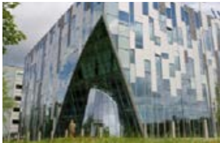
A.A. Hijmans van den Berghgebouw Universiteitsweg 98 3584 CG Utrecht