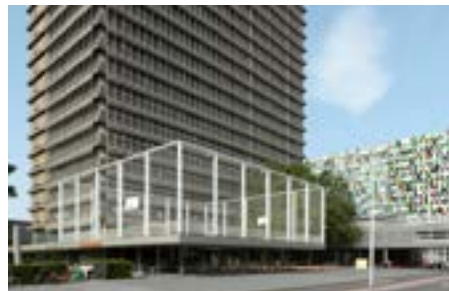
W.C. van Unnikgebouw Heidelberglaan 2 3584 CS Utrecht