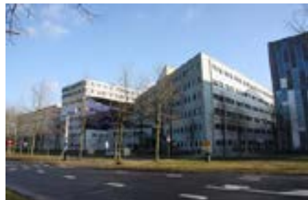
Stratum Universiteitsweg 100 3584 CG Utrecht