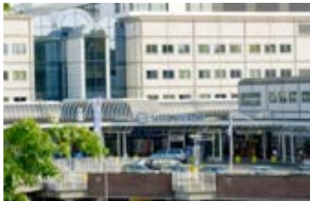
AZU/UMC Utrecht Heidelberglaan 100 3584 CX Utrecht

Het meeste onderwijs van Klinische Gezondheidswetenschappen vindt plaats in het Hijmans van den Berghgebouw, soms moet er echter worden uitgeweken naar één van de andere onderwijsgebouwen op de Uithof. Hieronder vind je de adressen van de onderwijslocaties.