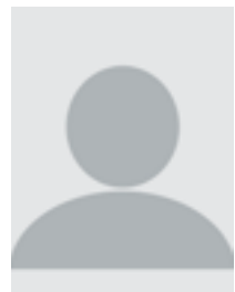
Programmacoördinator Gezondheidsweten- schappen voor zorg- professionals