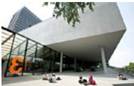
Educatorium Leuvenlaan 19 3584 CE Utrecht