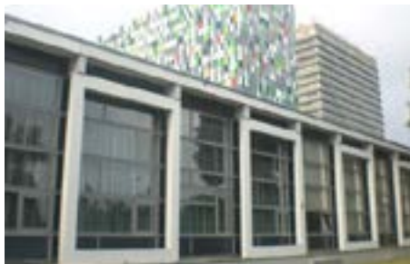
Marinus Ruppertgebouw Leuvenlaan 21 3584 CE Utrecht