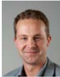
Dr. Marco van Brussel Onderzoeksontwerp