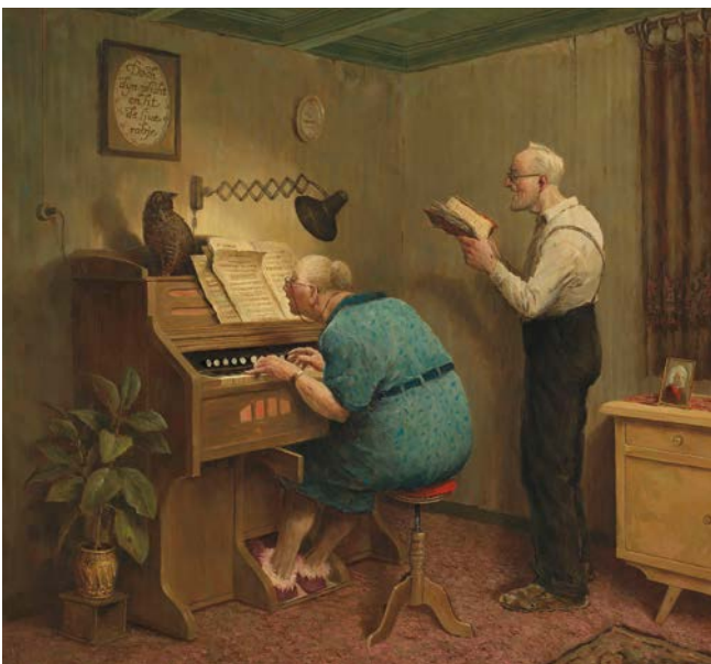
Zoals de ouderen zongen, door Marius van Dokkum ©2005 Art Revisited, Tolbert

“Dus één centrum waarin zorg en welzijn dicht bij elkaar zitten, maar waar vooral de burgers zelf van alles en nog wat kunnen doen. Op het gebied van bewegen, lezen, dansen, eten, actie, koken, voeding moeten we natuurlijk meepakken. [...] En dan heb je ook die signaleringsfunctie. Want dan weet die vrijwilliger die daar werkt dat jij misschien niet gekomen bent of verward bent of er anders uitziet. Dus dat lijkt mij eigenlijk niet zo heel ingewikkeld en wel heel veel opleveren.” (Huisarts en docent kaderopleiding ouderengeneeskunde)