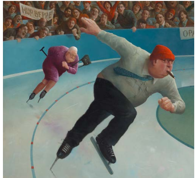
Rondje 80, door Marius van Dokkum ©2005 Art Revisited, Tolbert