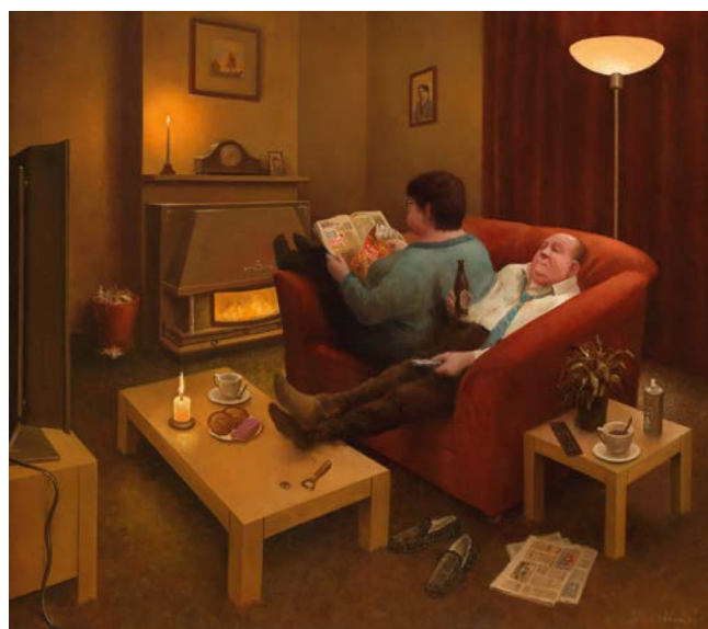
Als het buiten stormt, door Marius van Dokkum ©2005 Art Revisited, Tolbert

Dus ze maakt eigenlijk een plan waarvan ze denkt: ‘Dat is nodig’ maar dan passeert ze me niet, dus ze zegt eigenlijk altijd wat ze dan gaat doen en dat vind ik mooi. Je wordt in je waarde gelaten en dat vind ik belangrijk (Man, 87, alleenwonend, weduwnaar, wetenschappelijk onderwijs)