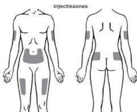
Afbeelding: injectiegebieden voor subcutane injecties 1

Voor subcutane (pijn)behandeling worden ook andere gebieden gebruikt (zie subcutane infuusbehandeling en subcutane pijnbehandeling).